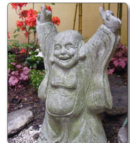
Glücks-Buddha im Zen-Garten