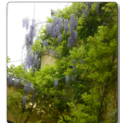
Ausblick vom Unterrichtsraum auf den Zen-Garten (Glyzinienblüte)