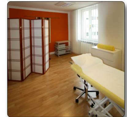
Die Lehrpraxis im ZfN

Wir werden Sie mit unserer umfassenden und praxisorientierten Ausbildung in dieses weite und sehr erfolgreiche Berufsfeld führen.